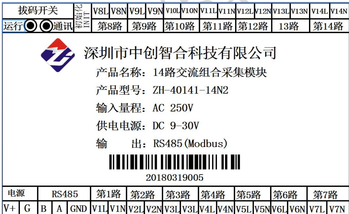
图二、产品引脚定义图