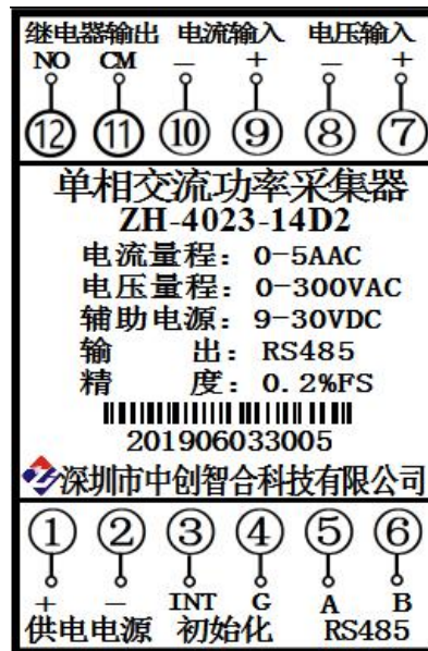
图 5.1、产品接线参考图（左图为电流穿孔输入，右图为电流 9、10 接线端子输入）