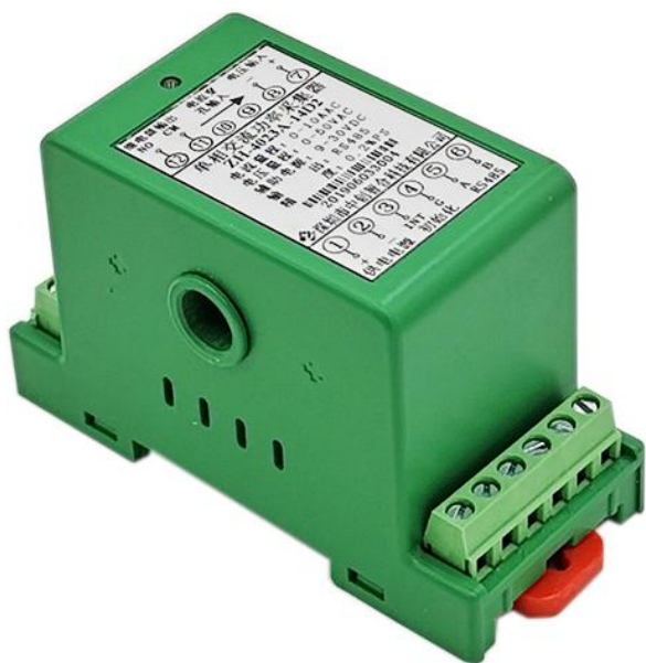
图 4.1、外观图（导轨安装）