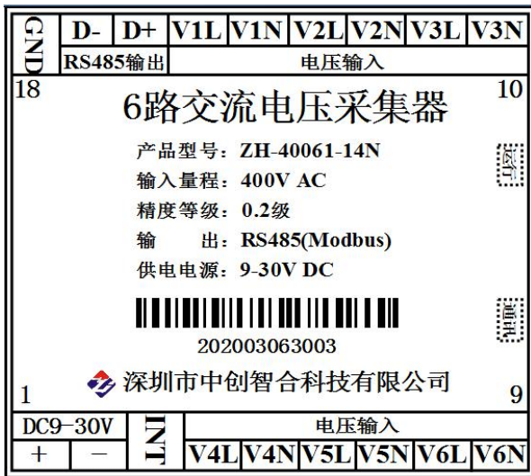
图 5.1 6路电压输入引脚定义图