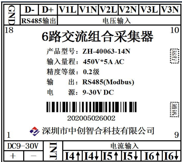
图 5.3 3路电压3路电流组合引脚定义图（功率测量时电压要与电流通道对应，如V1与I4为一组通道）