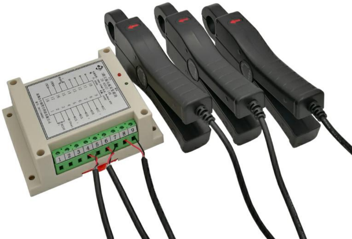
附图 1：外接电流钳的方式，我公司可提供电流钳配套标定，精度高。